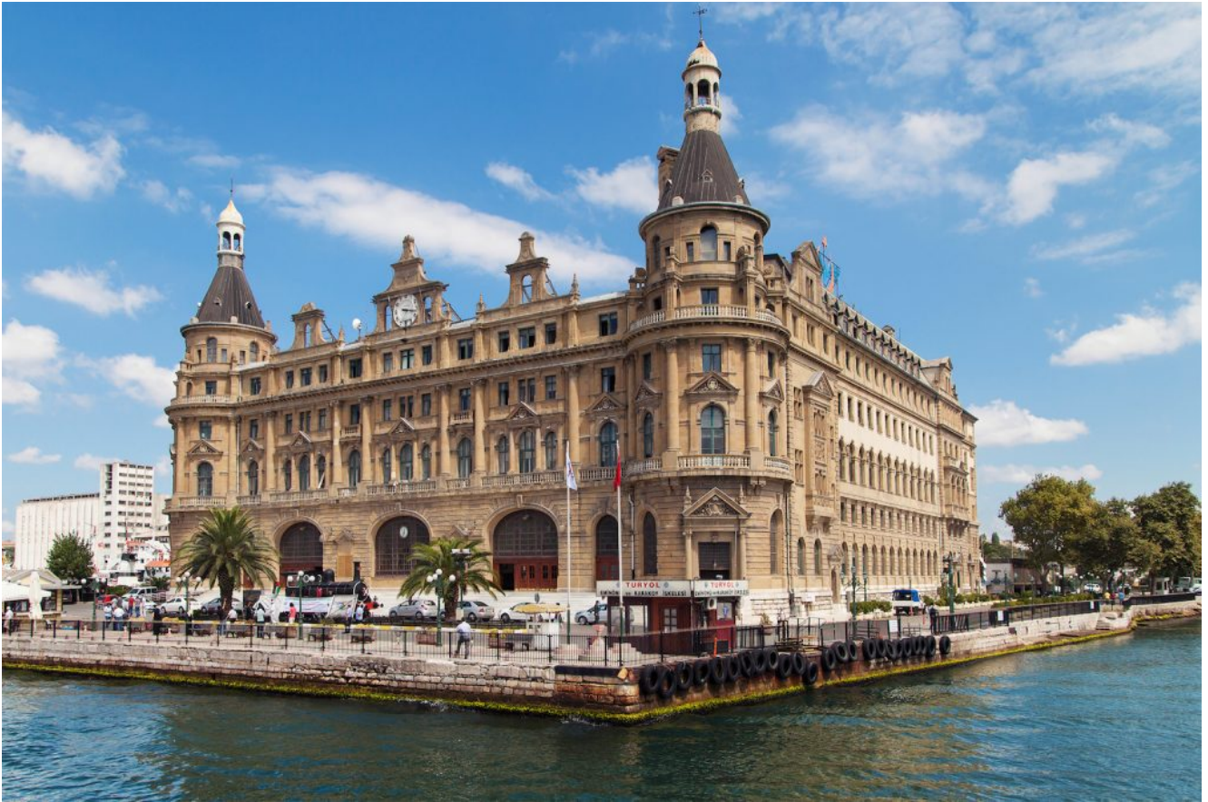
Stazione Ferroviaria Istanbul