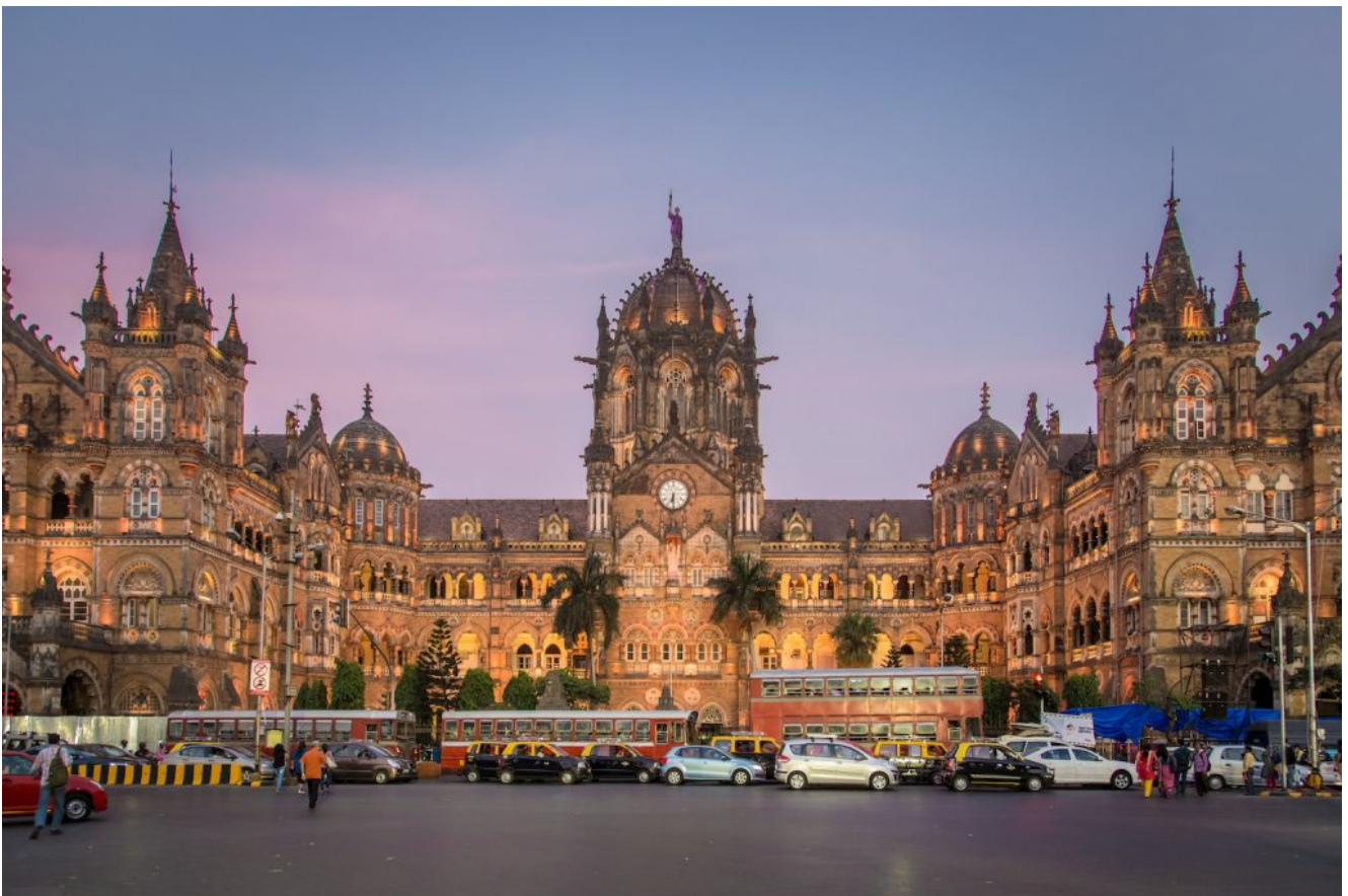
Stazione Ferroviaria India

Dichiarata Patrimonio dell'Umanità nel 2008, è ogni giorno percorsa da migliaia di persone. Chiamata "Victoria Station" nel 1887 e rinominata nel 1996, è diventata un punto di riferimento dell'architettura indiana riformulando il gotico vittoriano con un progetto rivoluzionario dell'artista inglese Frederick Williams Stevens.